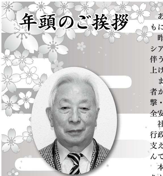
社会福祉法人 斜里町社会福祉協議会